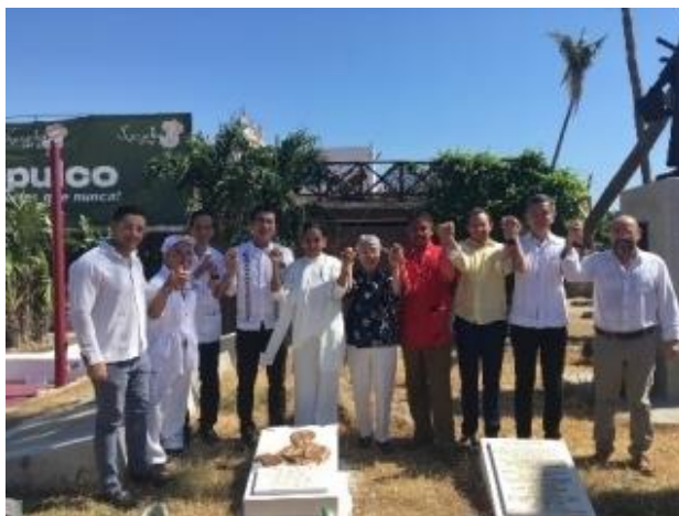
En la Plaza Japón en honor a Hasekura