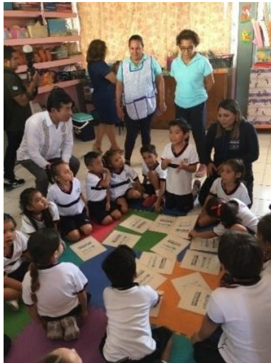
En el Centro de Desarrollo Infantil