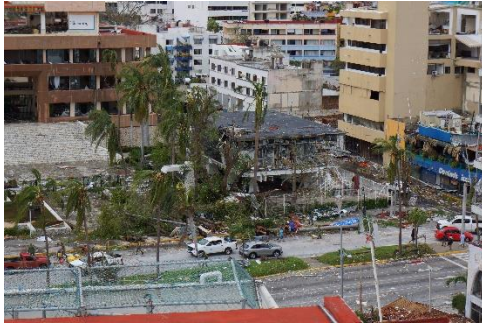
全壊した銀行(写真中央)

この美しい街並みが一夜にして悪魔の足跡のように破壊されようとは誰も予想しなかったことでしょう。