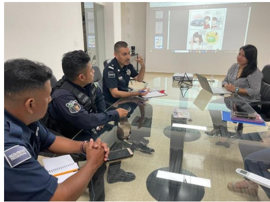
州全体を見据えた普及活動について州警察幹部との実務者会議の様様