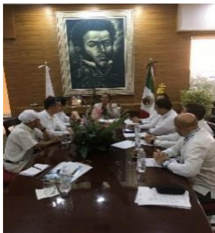
Con la presidenta municipal de Acapulco