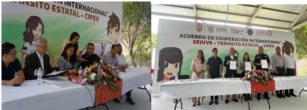
Figuras 6 y 7. Firma del Convenio de Cooperación Internacional