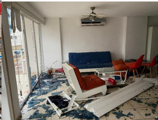
全壊した部屋、ガラス片が部屋中に散乱

嵐の後には略奪者たちが市中を跋扈(ばっこ)し、手当たり次第に略奪をしている。嵐も怖い但他们はもっと怖い。スーパーに押し寄せた略奪者たち、略奪品