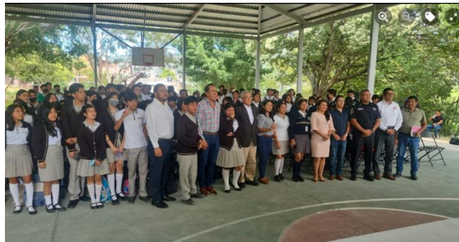
Fig. 8. Autoridades, invitados de honor y estudiantes en una fotografía conmemorativa.