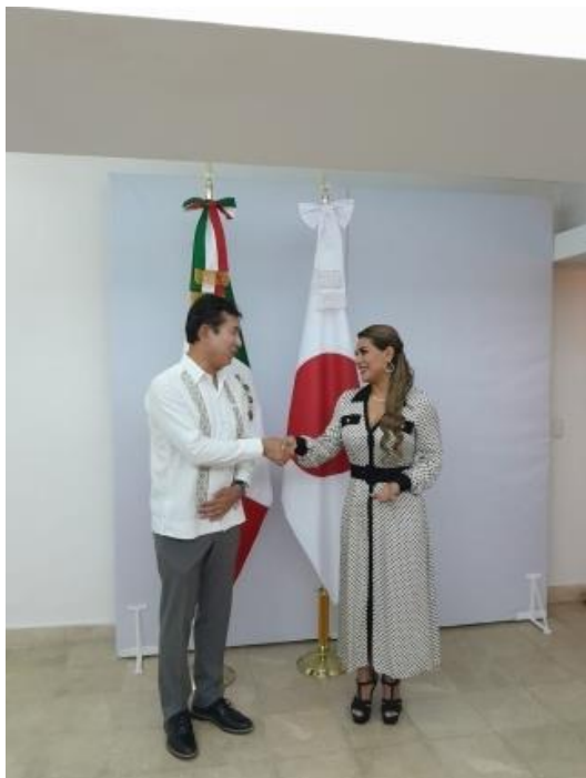
Con la gobernadora de Guerrero

reconstrucción. El día 27, participó en una ceremonia para conmemorar el 410° Aniversario de la Visita de la Misión Hasekura en la Plaza Japón.