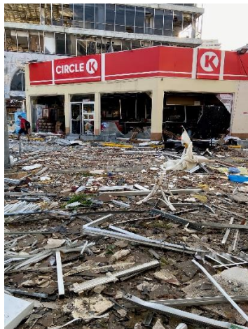
全壊したサークル K